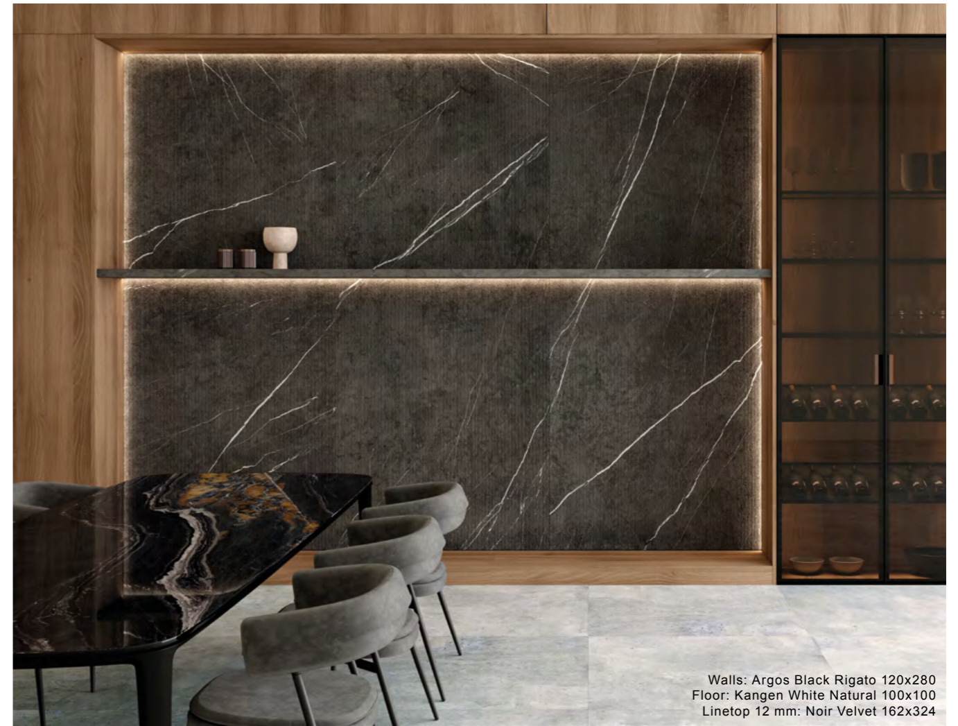
Walls: Argos Black Rigato 120x280 Floor: Kangen White Natural 100x100 Linetop 12 mm: Noir Velvet 162x324